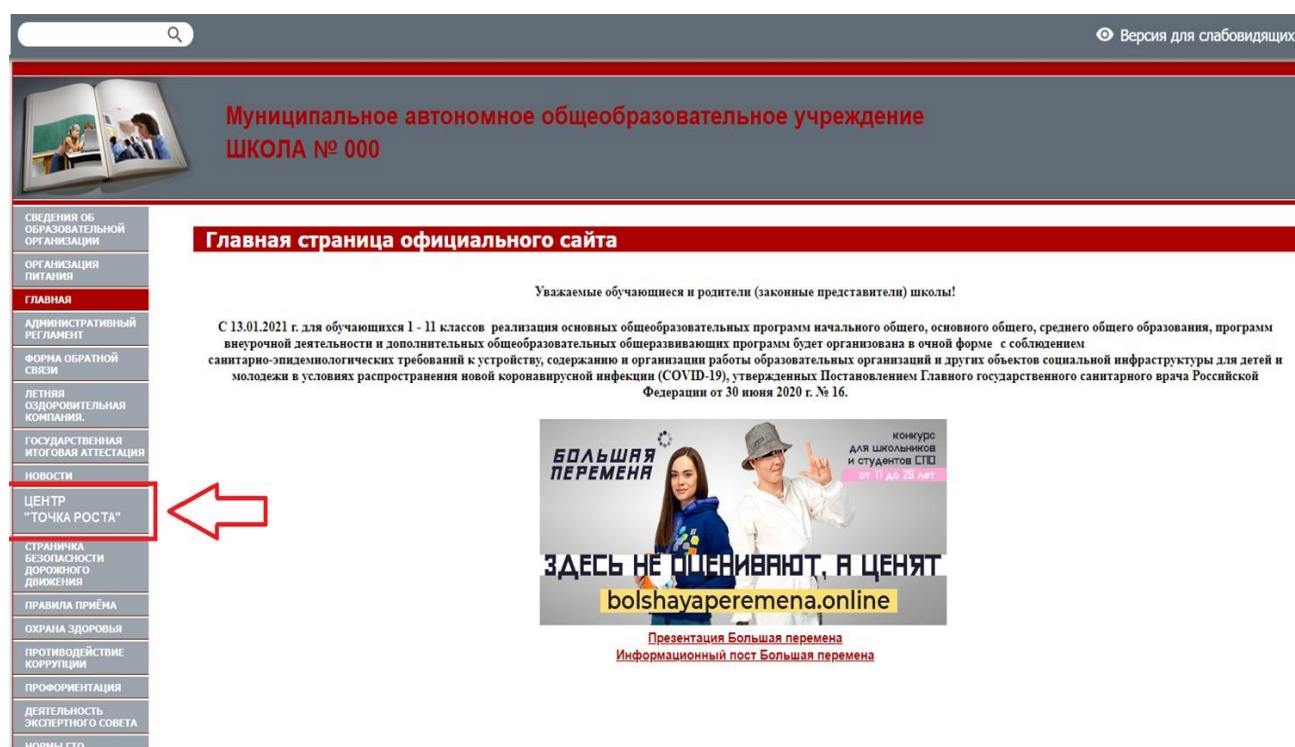
Рисунок 2. Пример размещения ссылки на раздел на сайте общеобразовательной организации

Пример размещения ссылки на раздел «Центр «Точка роста» в меню официального сайта общеобразовательной организации в сети «Интернет» приведен на рисунке 2.